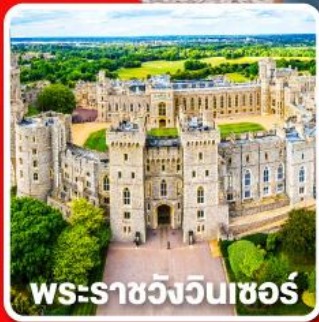
พระราชวังวินเซอร์

พักลอนดอน 4 คืนและ อิสระให้ท่านได้เที่ยวลอนดอนแบบเต็มอิ่ม 1 วัน